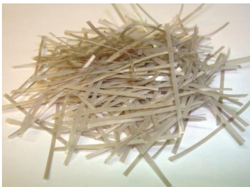
Strux 90/40 kuituja

Kuitujen pituus: 40 mm Hoikkuusluku: 90 Kimmomoduuli: 9.5 GPa Vetolujuus: 620 MPa Sulamispiste: 160 °C Alkali-, happo ja suolakestävyys erinomainen.